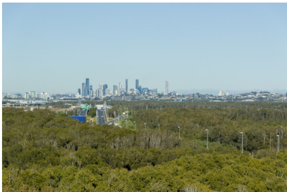
Udsigt over Brisbane set fra vores hotelværelse.

Vi besluttede hurtigt at få en fast base under hele opholdet, hvor vi kunne have alle de ting stående, vi ikke havde brug for på vores ture, derfor lejede vi en AIRB&B. Turen skulle også foregå i vintermånederne (i Australien), for der er temperaturen nogenlunde som vores sommer. Minusset er, at dagene er korte og det er lidt køligt om formiddagen.