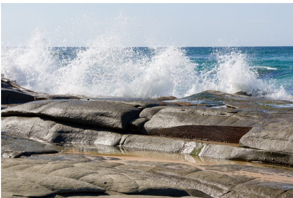
Vores base lå ikke langt fra den australske stillehavskyst.

gen kom over højtalerne kort efter. Det regnede så meget, at det var umuligt at se landingsbanen, så der var ikka andet at gøre end at afbryde landingen og forsøge igen. Det gjorde han så omkring 15 minutter senere, uden at resultatet ændrede sig. Så blev beslutningen at vi cirklede i en time til halvanden, og så forsøge landing endnu en gang. Der blev i den grad krydset fingre og tæer, for at det ville lykkes denne gang. Det gjorde det ikke. Flyet havde nu ikke så meget brændstof på, at det var forsvarligt at prøve endnu en gang, så vi skulle til Alice Springs for at tanke op. Her fik vi så at vide, at der ikke ville