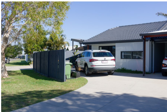
Vores base i Australien.

På turen til Uluro skulle vi have de to ældste børnebørn på 7 og 11 år med og flyve fra Brisbane, en tur på cirka 3½ time. Vejrudsigten for bestemmelsesstedet lovede regn, noget der er sjældent midt inde i Australien, så vi var fortrøstningsfulde, hvor slemt kunne det blive. Alt gik da også fint og piloten lagde an til landing da vi var nået frem. Men lige inden vi var nede trak han flyet op igen.