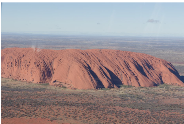
Uluro set fra helikopteren.

Turens højdepunkt skulle være en helikoptertur over nationalparken. Det var en oplevelse! For os alle sammen var det første gang vi skulle flyve i helikopter. Det var et fantastisk overblik man fik og piloten havde en masse ting at fortælle om hvad vi så og om historien bag. Sådan en tur på 25 minutter går hurtigt.