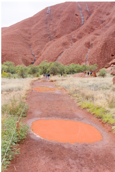
Store pytter på stien rundt om Uluro.

plads til os alle fire, så det var ikke rigtig en løsning. Der holdt en enkelt Taxa i lufthavnen, så vi fik den ide at finde ud af, hvad mon sådan en tur ville koste. Chaufføren ville sådan set gerne køre, men han skulle lige konferere med sin kone. Det var jo en tur på 5 timer ud og 5 timer hjem. Konen sagde, at det kunne der ikke være tale om, men så fik han den ide, at ringe til en ven, der var Uberchauffør. Han ville gerne, men skulle have betalingen kontant. Så