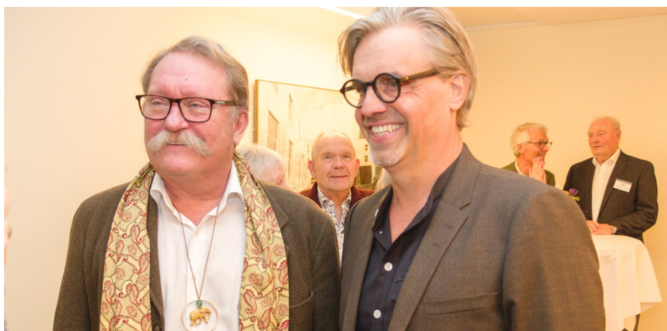
Den afgående og den nye forstander samlet ved receptionen den 30. januar 2024.